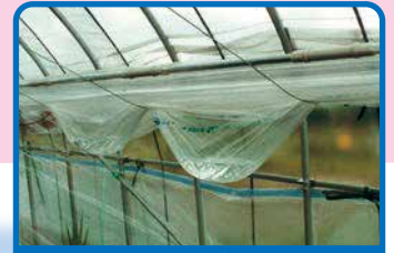
一般カーテン（金魚鉢現象）